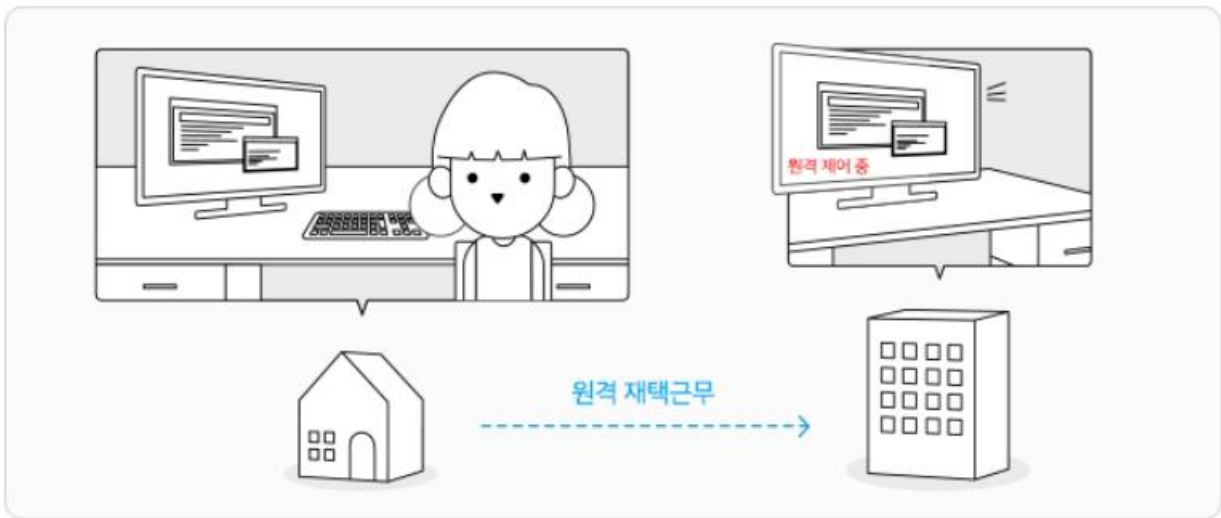
<회사의 PC를 그대로 제어할 수 있는, 원격제어 리모트뷰>

그렇기 때문에 기업에서는 별도의 직원 교육이나 프로그램 설치 없이 원격근무를 안정적으로 도입할 수 있습니다.