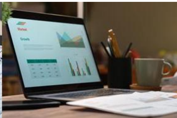
重塑灵活协同模式

在经济周期波动中，企业急需一种高效方案，在不牺牲生产效率的前提下，大幅 削减人力开支 与运营成本。