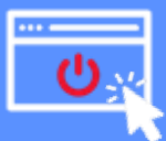
极简部署与高效交互