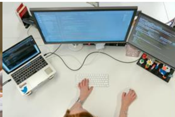
驱动业务高效流转

打造打破时空限制、安全可靠的办公环境。确保员工在分支机构或差旅途中，均能获得与办公室 一致的数字化工作体验 。