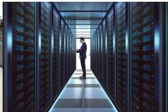
强化集群管理能力

当内部 IT 资产或交付给客户的终端设备出现故障时，无需工程师亲赴现场，即可实现 分钟级的远程快速响应 与排障。